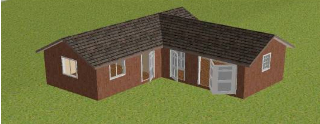
Skisse av uthuset – inn mot tunet

Eigedomen har tidlegare vore nytta som kårbustad under Vaagen Søndre og det stod opprinneleg 3 bygningar her. Ved å vidareføre dette, gjev eigedomen inntrykk av å vere ein setervoll/landbrukseigedom meir enn ein fritidseigedom. Dette høver godt i området som er regulera til LNF.